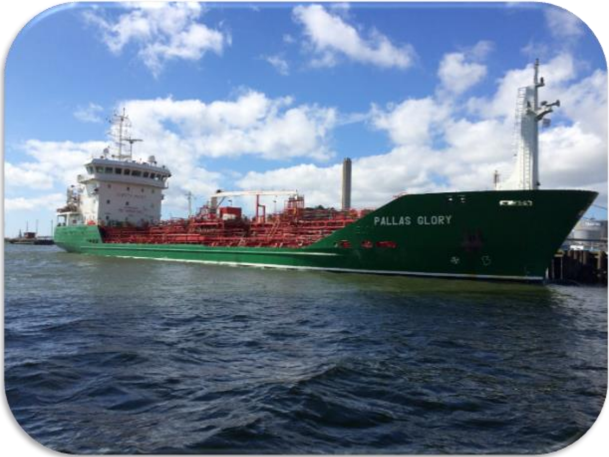
Bunkringsfartyget Pallas Glory vid lastning på en oljeterminal