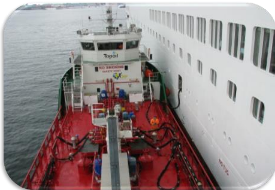
M/T PALLAS förser ett kryssningsfartyg i Köpenhamn med bränsle.

**Externa värderingar som erhöles i maj 2015, utifrån nuvarande inseglingsrater, av bunkerfartygen visar ett övertvärde på 20,9 Mkr jämfört med bokfört värde.