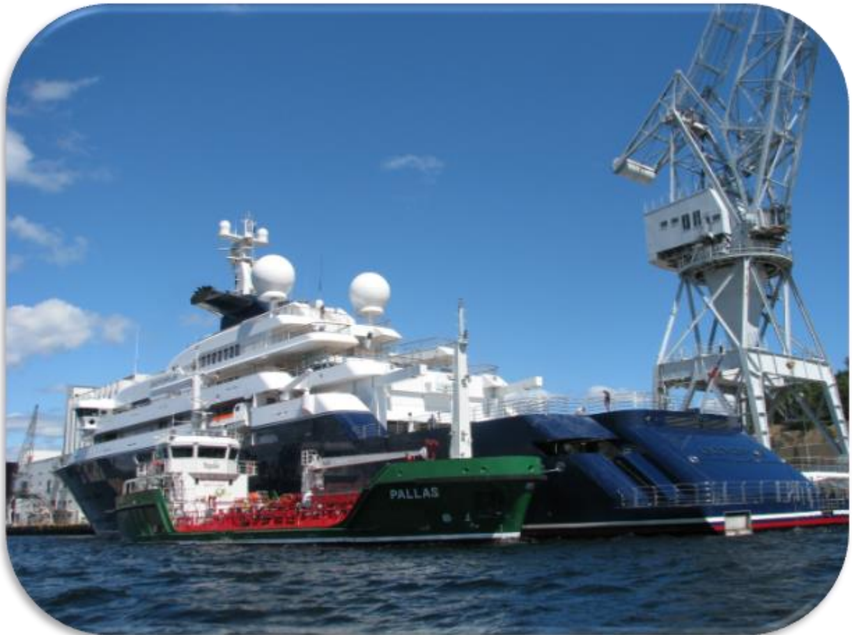
M/T Pallas förser en lyxyacht med bränsle.