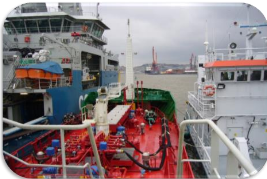
M/T Pallas medverkar i övning med Kustbevakningen.