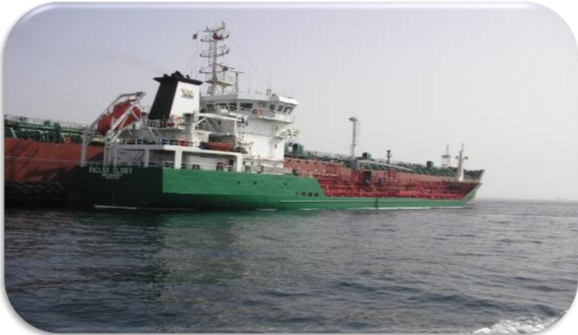
Bunkringsfartyget Pallas Glory utför en bunkring i Gibraltar.